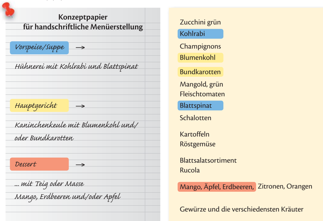
Abb. 20/2 Zuordnung von Obst und Gemüse

Zur Zuordnung von Obst und Gemüse markieren Sie Ihre Auswahl (mit Alternativen) und übertragen Sie sie ins Konzeptpapier.