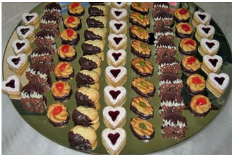
Teegebäck zur Abschlussprüfung