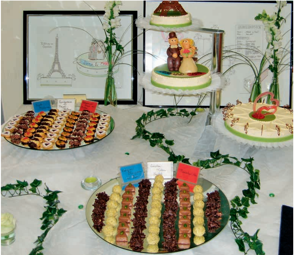
Prüfungstisch zur Gesellenprüfung

Ihre praktische Prüfung ist bestanden, wenn jeweils in der praktischen und schriftlichen Prüfung sowie innerhalb der praktischen Prüfung in der Arbeitsaufgabe A mindestens ausreichende Leistungen erbracht worden sind. Werden die Prüfungsleistungen in einem fachbezogenen Prüfungsbereich mit „ungenügend“ bewertet, ist die Prüfung nicht bestanden.