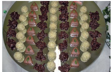
Pralinenmischung zur Abschlussprüfung