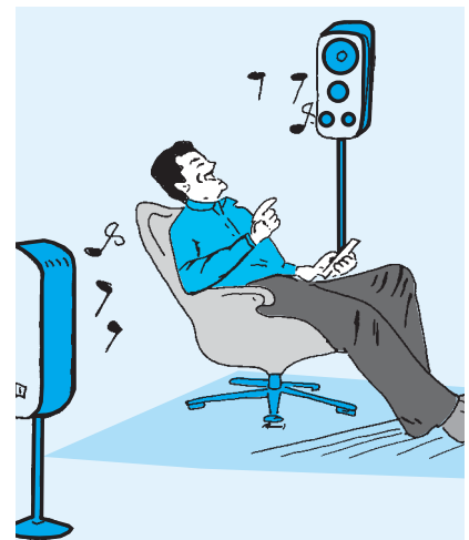
The new loudspeakers sound perfect.