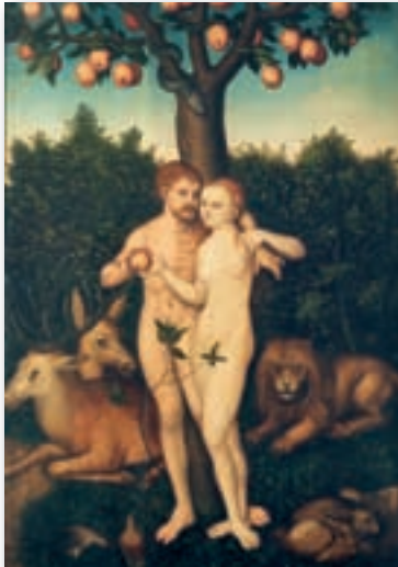
a) Lucas Cranach d. Ä.: Adam und Eva (1526)