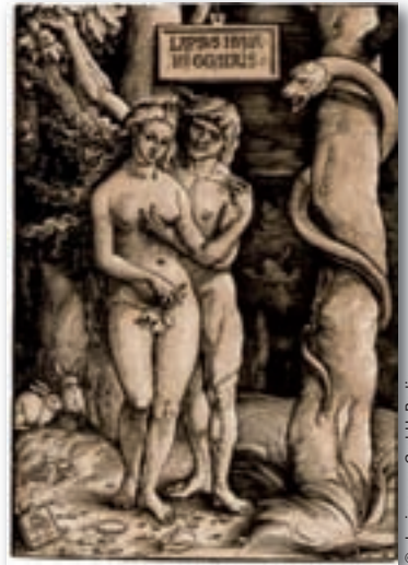
c) Hans Baldung Grien: Adam und Eva (Gen 2-3) (1511)