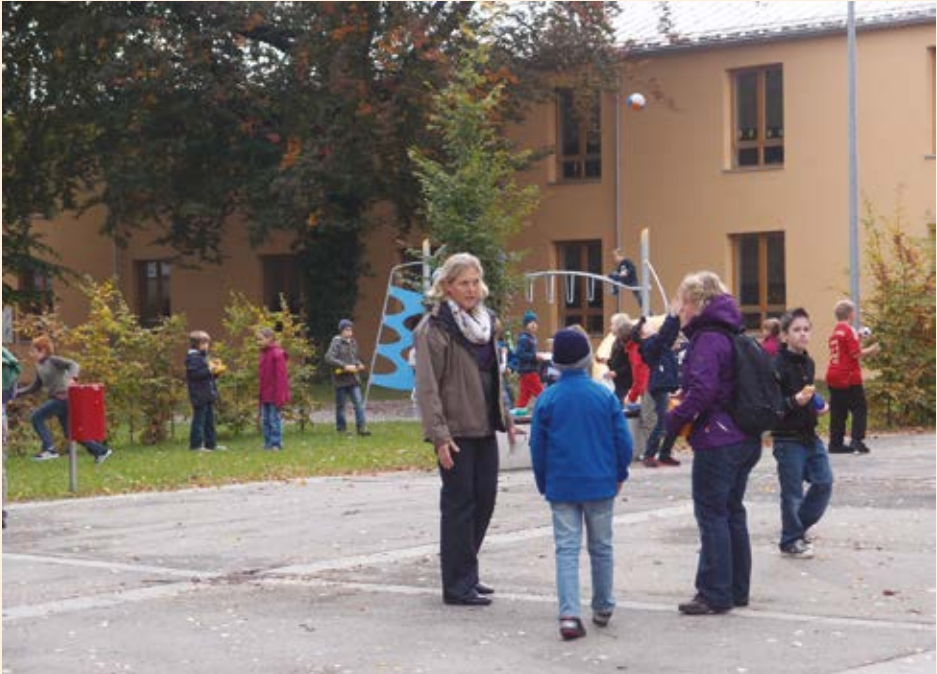
Pausenaufsicht in einer Grundschule