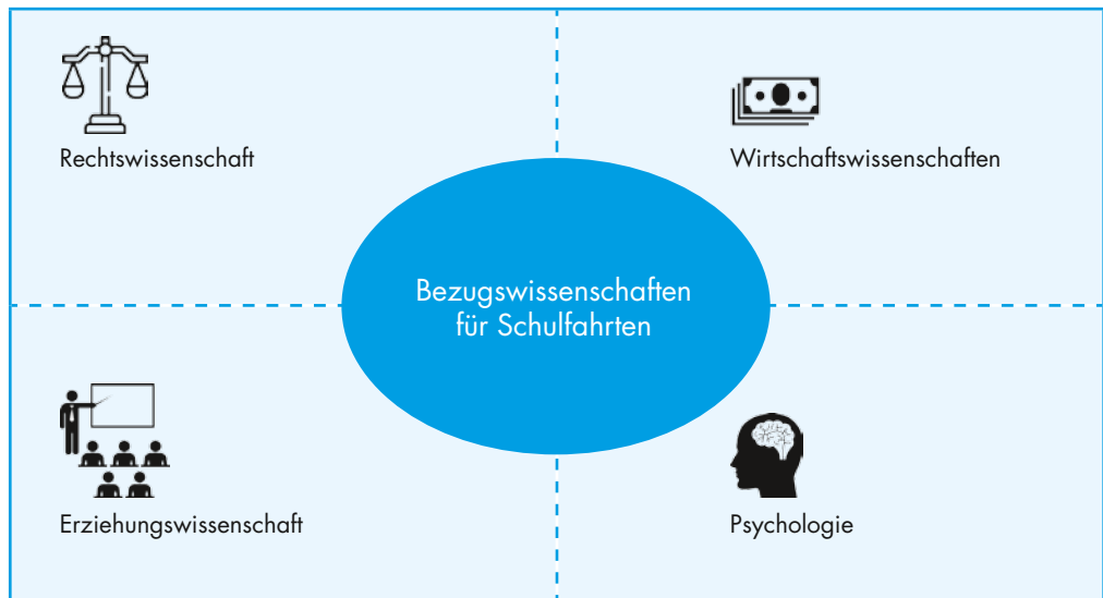
Abb. 2: Bezugswissenschaften für Schulfahrten

Im Anschluss daran wird die jeweilige Situation grundlegend aufbereitet – ausgehend von Praxisfällen und angereichert mit Tipps, Empfehlungen, Hinweisen und Beispielen aus Praxis und Theorie. Dabei steht die Praxis im Mittelpunkt, da die Situationen von dort stammen; handlungsleitende Theorien aus verschiedenen Bezugswissenschaften (Erziehungswissenschaft, Psychologie, Wirtschaftswissenschaften und Rechtswissenschaft) bilden oft einen Hintergrund, der zu Fundierung und Begründung beiträgt.