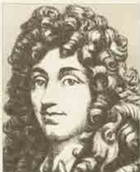
Christian Huggens 14.1.1629—2.7.1695