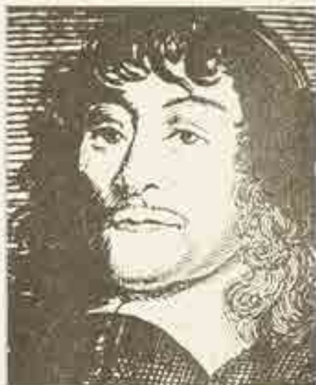
Erasmus Bartholomaeus 13.8.1625—4.11.1698