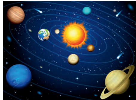
Regelkreisläufe der Systemtheorie finden sich z. B. auch in der Astronomie (Planetenbahnen).

Mithilfe der Systemtheorie lassen sich verschiedene Zusammenhänge und Wirkungsweisen in unterschiedlichen Wissenschaften und ihren Phänomenen erklären und verstehen. Mittels dieses Erklärungsansatzes kann der Mensch sich und seine Umwelt verstehen lernen, da komplexe Zusammenhänge und ihre gegenseitige Beeinflussung, sogenannte Regelkreisläufe , beobachtbar und damit erfahrbar gemacht werden können. Diese Theorie mit ihren unterschiedlichen Strömungen verbindet gewissermaßen Wissenschaften und ihr Denken. Es finden sich systemtheoretische Erklärungsansätze in der Biologie, wo sie zunächst entwickelt wurde, in der Soziologie, der Ökologie, der Ökonomie sowie in den Kommunikationswissenschaften und auch in der Astronomie, um nur einige zu nennen.