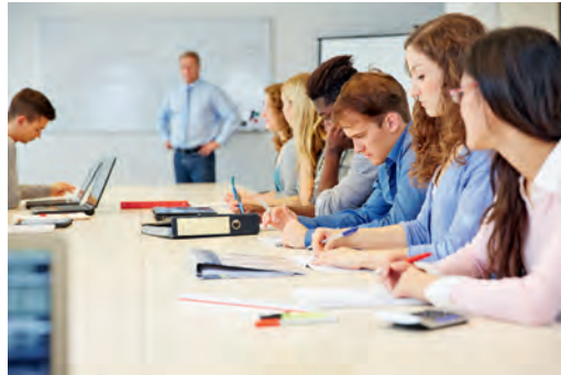
Studium in der Pflege

Die American Association of Colleges of Nursing (Amerikanische Vereinigung der Hochschulen der Pflege) sprach bereits im Jahr 1986 inhaltliche Empfehlungen für das generalistisch ausgerichtete Bachelor-Studium aus, die in einem Curriculum zum Bereich „Familie“ berücksichtigt werden sollen. Studierende sollen in diesem Bereich ihrer Ausbildung lernen, die Familie methodisch gezielt einzuschätzen, dabei Familienstrukturen und Entwicklungen sowie Kommunikationsprozesse in der Familie zu erkennen. Das schließt das Identifizieren von Problemen in der Familie und die Weitervermittlung solcher Familien an adäquate Einrichtungen ein.