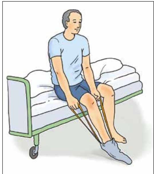
Anziehhilfe für Socken

Die veränderte Struktur und Funktion des Hüftgelenks beeinträchtigen vor allem die Aktivitäten: An-/Auskleiden, Körperpflege der Füße, Gehen und Bücken .