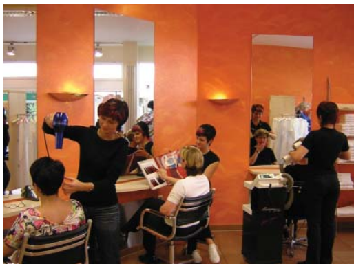
1.5 Moderner Friseursalon