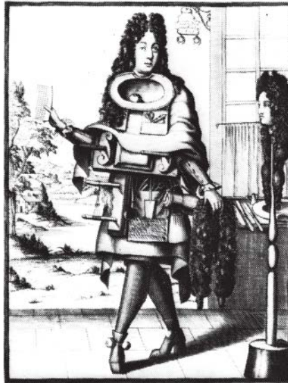
1.3 Der Perückenmacher (Barock)