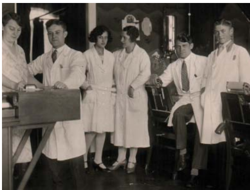
1.4 Friseursalon 1934

Arbeitsbedingungen 1934. Damals kostete eine Dauerwelle 5,50 Mark. Für Waschen, Schneiden, Legen bezahlte die Kundin 2,00 Mark. Einen Herrenhaarschnitt gab es schon für 50 Pfennig. Die wöchentliche Arbeitszeit betrug 58 Stunden. Samstags waren die meisten Betriebe bis 16.00 Uhr geöffnet. Häufig begann das Wochenende erst um 18.00 Uhr. Sonntags wurden die Kunden von 9.00 bis 12.00 Uhr gekämmt. Der Urlaubsanspruch betrug je nach Betriebszugehörigkeit von 2 über 4 bis zu 8 Tagen im Jahr. Die Lehrzeit betrug für „Mädchen“ 3 ½ Jahre und für „Jungen“ 4 Jahre.