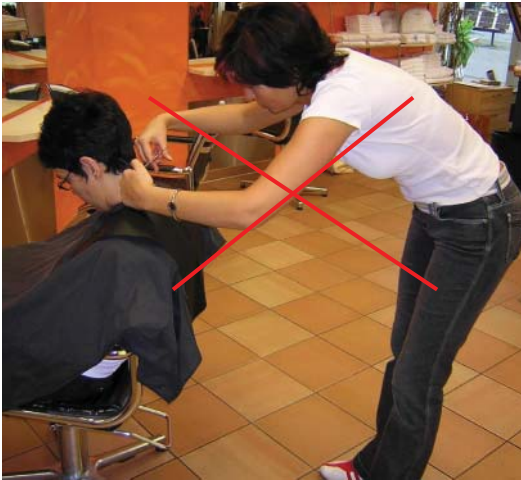
1.7 Falsche Körperhaltung