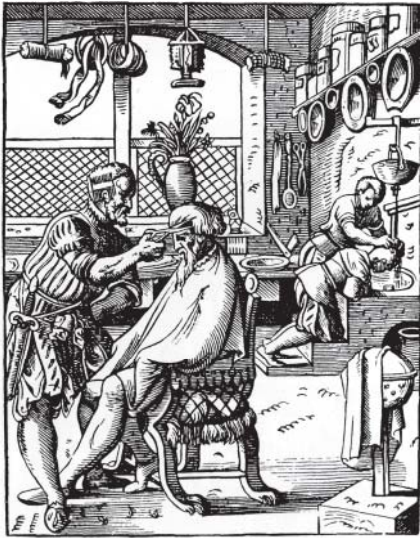
1.2 Barbierstube (Renaissance)