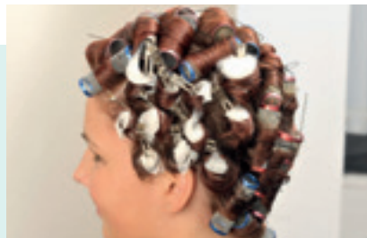
Bild 2 Frisurengestaltung mit zwei Einlegetechniken