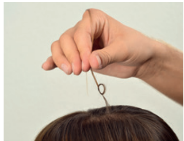
Bild 1 Haar- und Kopfhautbeurteilung