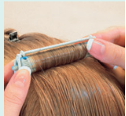
Bild 8 Befestigung des Wickels