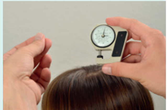
Bild 5 Ermittlung der Haarstärke