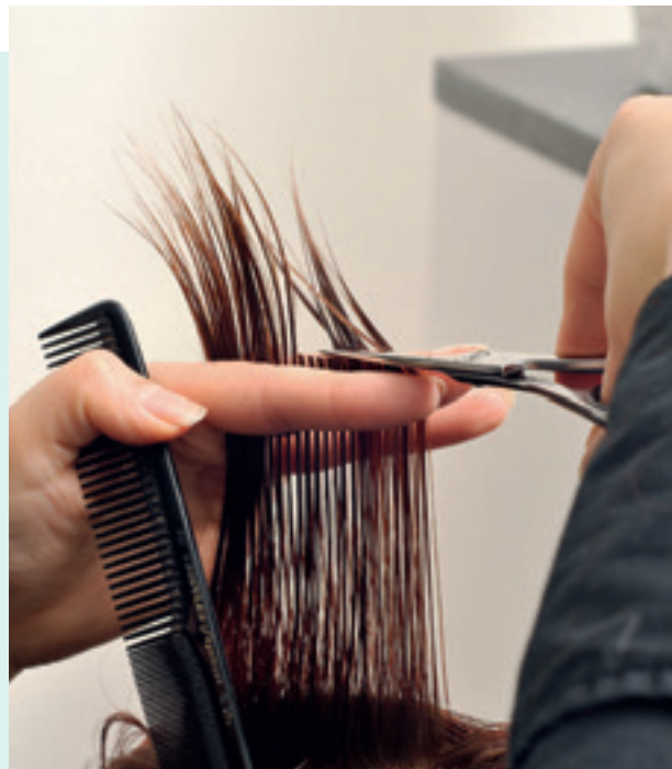
Bild 2 Haare schneiden

Die Gesellenprüfung besteht aus zwei Teilen, welche zeitlich auseinanderliegen: