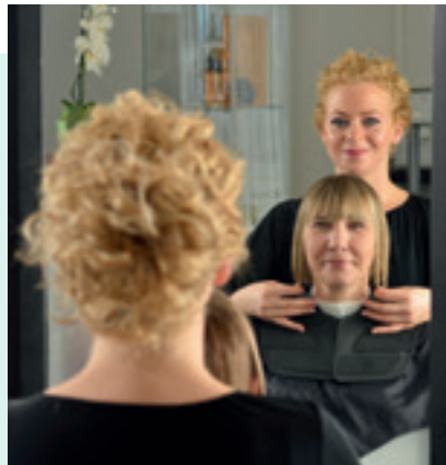
Bild 2 Friseurin im Umgang mit der Kundin