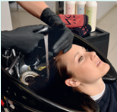
Bild 6 Anfeuchten der Haare