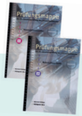
Bild 3 Prüfungsmappe des Zentralverbands des Deutschen Friseurhandwerks, Köln