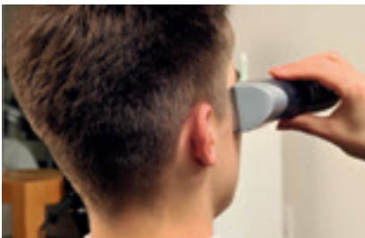
Bild 1 Klassischer Fasson