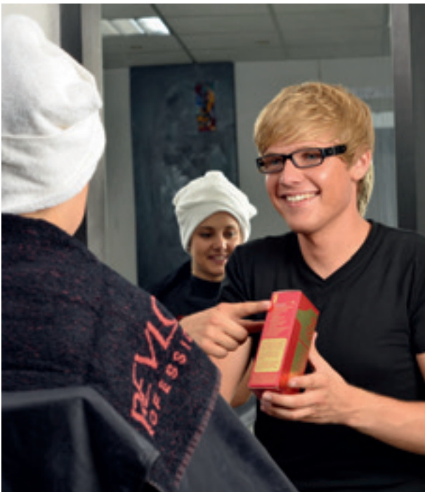
Bild 1 Kunden- und dienstleistungsorientiertes Handeln