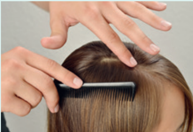
Bild 4 Ermittlung des Kopfhautzustandes