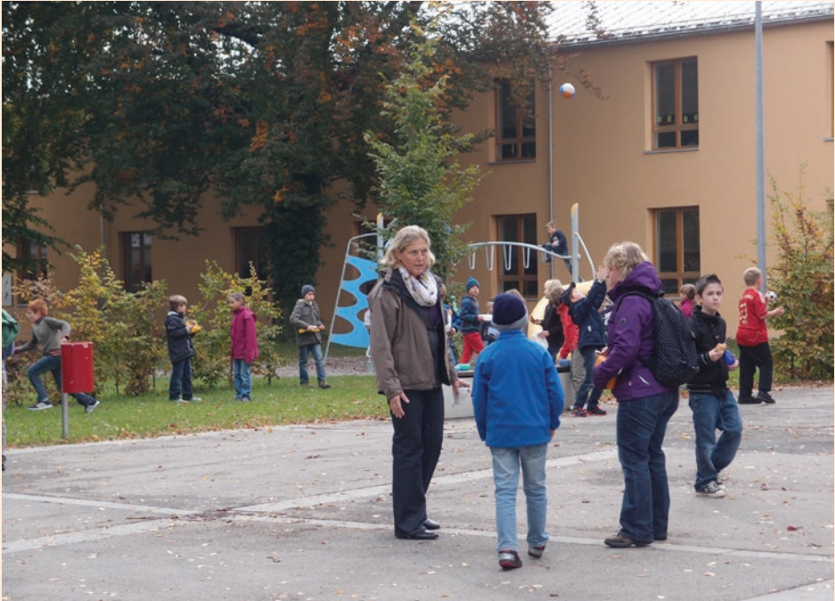
Pausenaufsicht in einer Grundschule