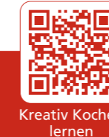
Kreativ Kochen lernen

Aufgabe: Wählen Sie zudem aus dem Kochordner Kreativ Kochen lernen 3 Snacks und 3 Mittagessen für einen „Meatless Day“. Nutzen Sie den Saisonkalender . Notieren Sie die Speisen auf dem Arbeitsblatt Vegetarismus . Wählen Sie aus allen Vorschlägen jeweils zwei Snacks/Mittagessen aus.