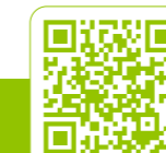
Kreativ Ernährung entdecken