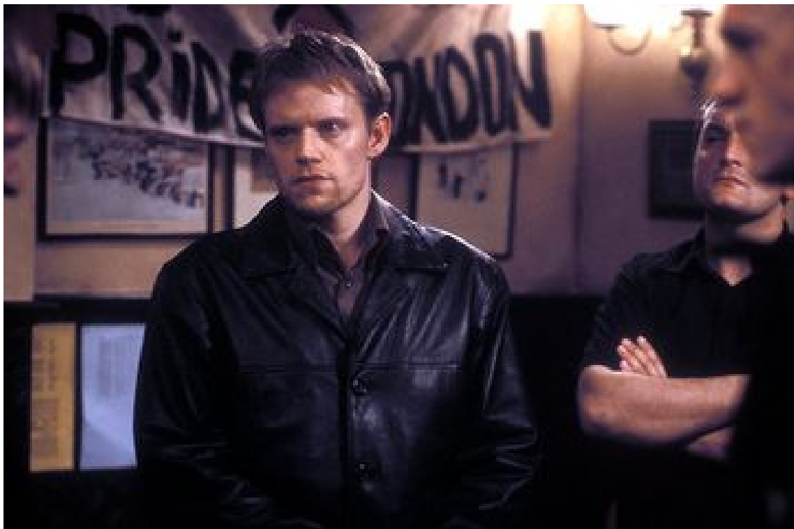
Gefunden unter http://www.rottentomatoes.com/quiz/ever-heard-of-the-gse/