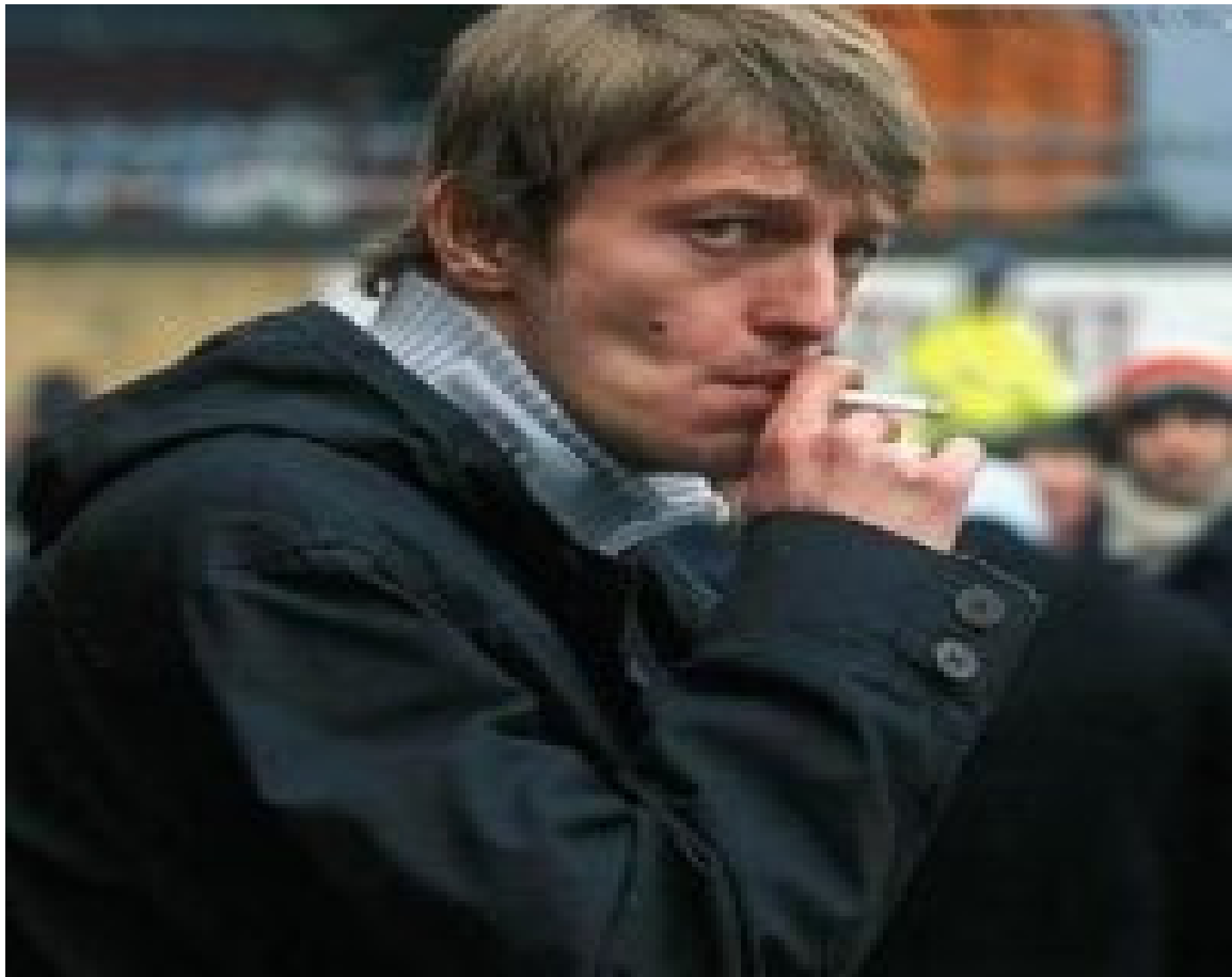
Gefunden unter http://profile.ak.fbcdn.net/hprofile-ak-snc4/50261_134346680648_7129336_n.jpg