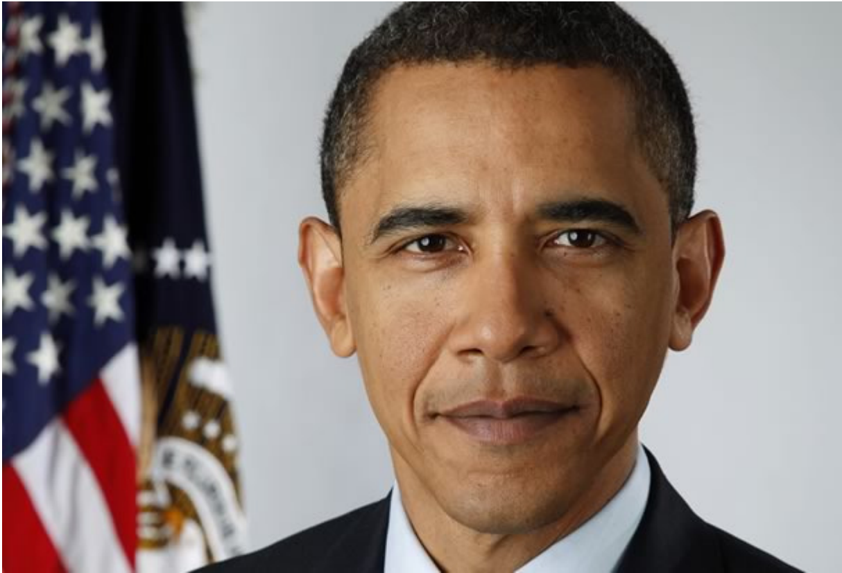
Gefunden unter de.wikipedia.org/wiki/Barack_Obama